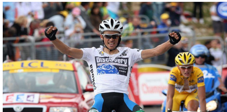
LEGENDA ALBERTO CONTADOR POJEDE L'ETAPE CZECH REPUBLIC

Bližší informace najdete na www.letapeczech.cz , vývěsních plochách, v Jáchymováčku a na FB Kultura v Novém Jáchymově.